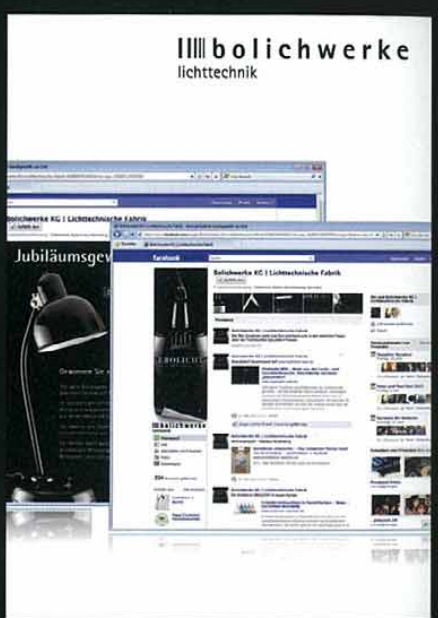
Bolichwerke, Social Media