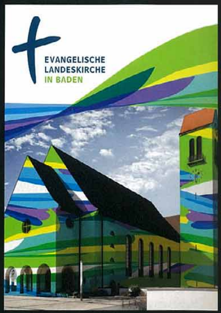
Evangelische Landeskirche Baden, Corporate Design