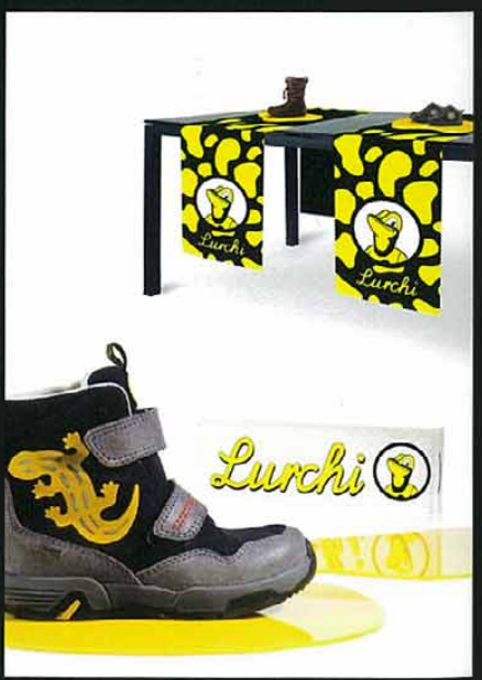
Lurchi, Visual Merchandising