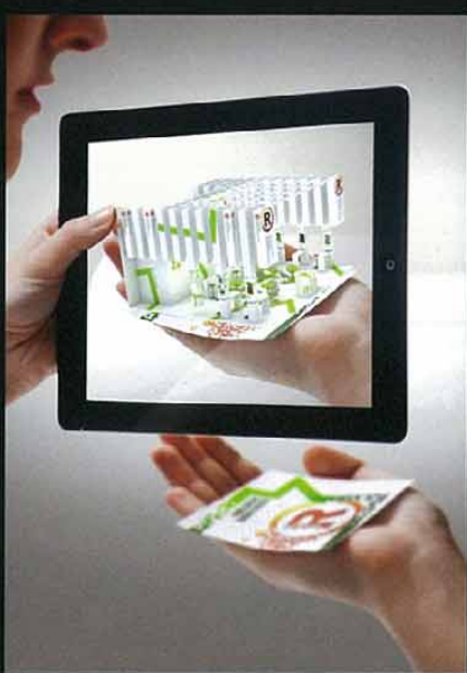
TechnologieRegion Karlsruhe, Augmented Reality